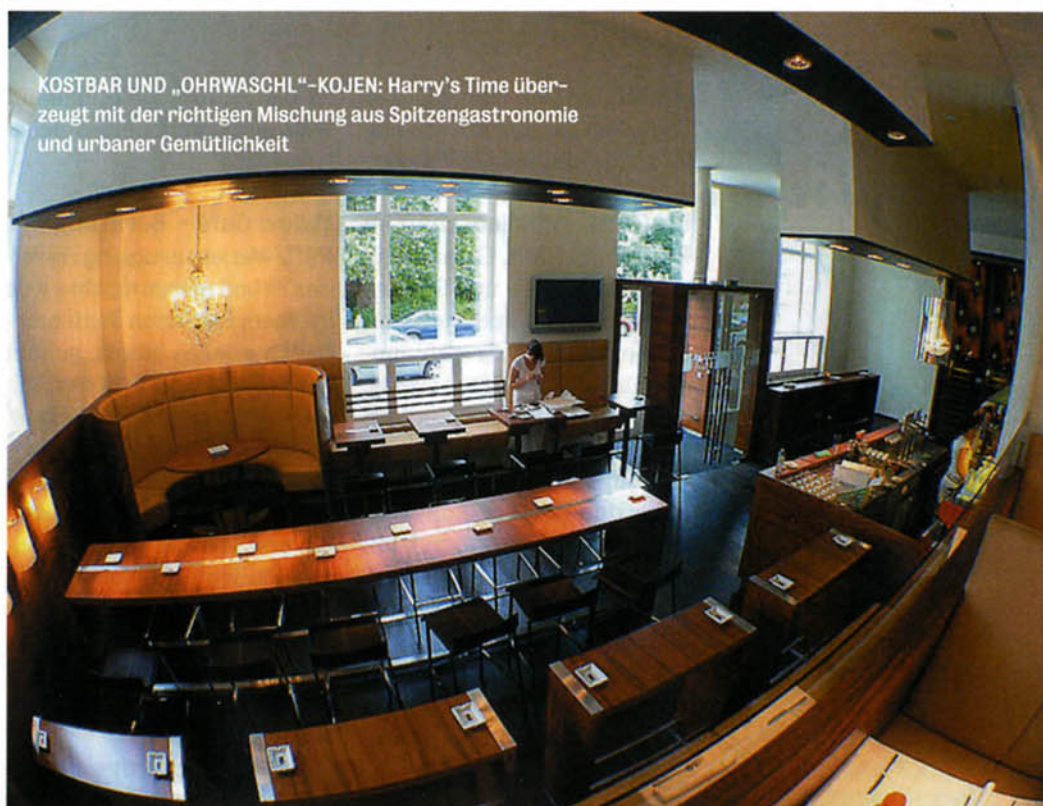
KOSTBAR UND „OHRWASCHL“-KOJEN: Harry's Time überzeugt mit der richtigen Mischung aus Spitzengastronomie und urbaner Gemütlichkeit

Vom Hauben- bis zum Inlokal: Tipps mit Geschmack für größere und kleinere Geldbörsen