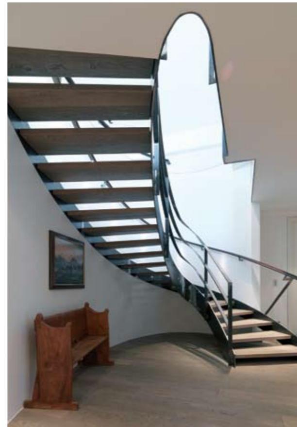
From left to right, from above to below: Bathroom on lower floor, View towards kitchen upper floor, Bathroom, Staircase. Right: Staircase and dining area.