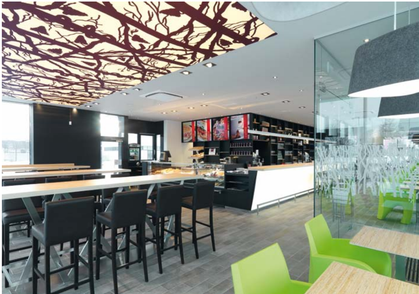
Bilder: Peter Burgstaller