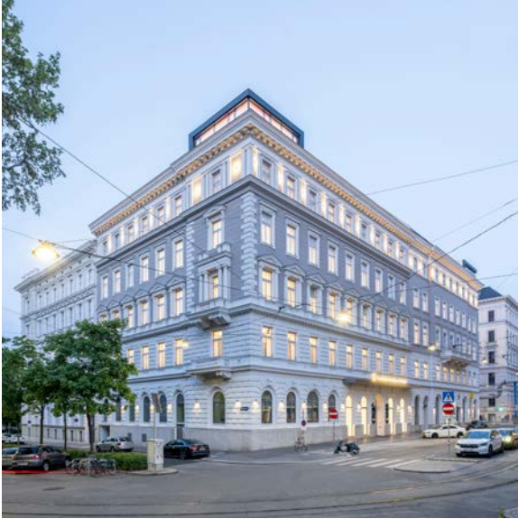
© Peter Burgstaller / Atelier Heiss Architekten

Bei dem Bauprojekt in der Peregringasse 2-4 handelt es sich um zwei aneinandergrenzende Bürogebäude aus der Wiener Gründerzeit. Beide Häuser verfügen über je ein Erdgeschoß, vier Obergeschoße und ein Dachgeschoß. Die Gebäude wurden je Obergeschoß zweimal miteinander verbunden. Die Sanierung ermöglichte eine vielfältige Nutzung für entweder kleinteilige Büroeinheiten bis hin zu großflächigen Single-Tenants. Das Erdgeschoß wurde häuserübergreifend als Supermarkt ausgebaut.