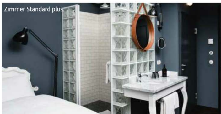
Zimmer Standard plus