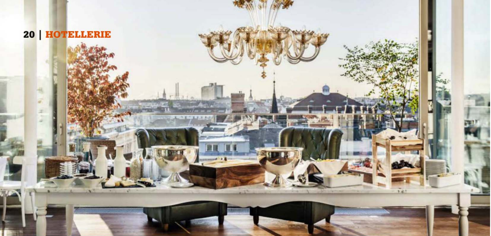
Herrlicher Ausblick: Grand Étage