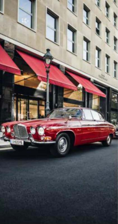
Grand Ferdinand am Schuberting.

position, zeitlose Eleganz und neuzeitigen Komfort. Da wird das Licht wie früher mit Keramikschaltern „aufgedreht“. Und die Duschwände aus Glasbausteinen sind eine Reminiszenz an die 1950er. Das Farbkonzept sieht in allen Zimmern ein Wechselspiel von geschwungenen Betthäuptern und Spiegelumrandungen in Weiß, dunklen Holzböden und anthrazitfarbenen Wänden vor. Der runde, mit Ledergurten umrandete Spiegel über dem Waschbecken ist ein von Gubi dem Stil von Jacques Adnet nachempfunder Designklassiker. Auch ein „Standard“-Zimmer ist mit einem komfortablen Kingsize-Doppelbett, einer Minibar im Lederkoffer sowie einer Regendusche ausgestattet. Etwas mehr Größe plus eine Chaiselongue aus grünem Leder und eine Champagnerbar verleihen der Kategorie „Standard+“ eine Portion Extravaganz – getoppt wiederum von der Kategorie „Business“ mit einem zusätzlichen Schreibtisch. Der Grazer Hoteliersonn tritt seit Jahren mit der Devise in den Ring, seinen Hotels ein gastronomisch-vitales Leben einzuhauchen. So lässt auch das Grand Ferdinand teilweise vergessene Genüsse im