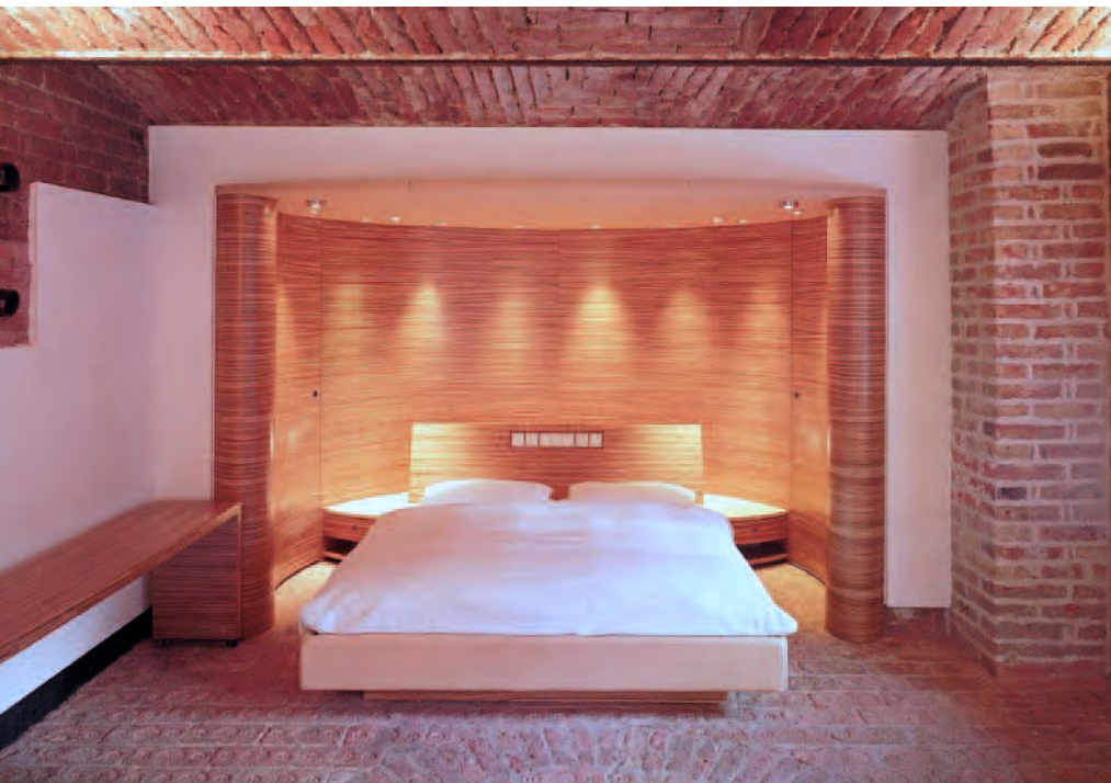
Babenbergerhof Hochzeitssuite: Allerlei Details, wie z.B. der kleine Spiegel im Bad, den sich die Hochzeiter teilen müssen, kommentieren die Paarbeziehung zwischen Individualismus und Gemeinsamkeit.